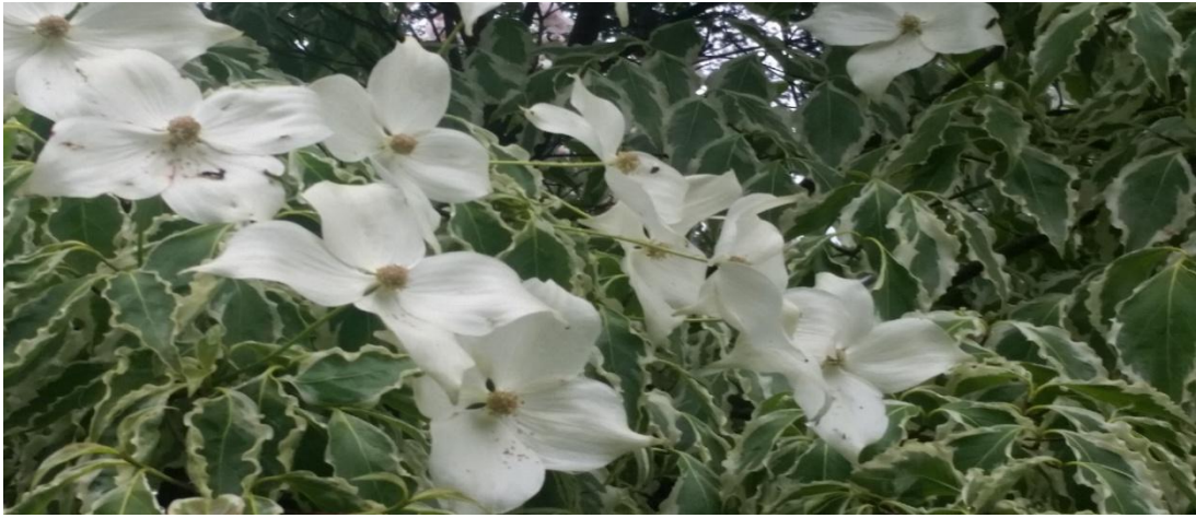
Oben: Cornus cousa „Samaritan“ mit weißumrandeten Blättern