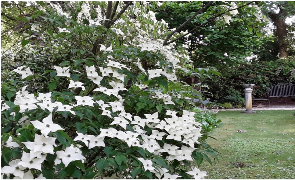
Cornus cousa „China Girl“