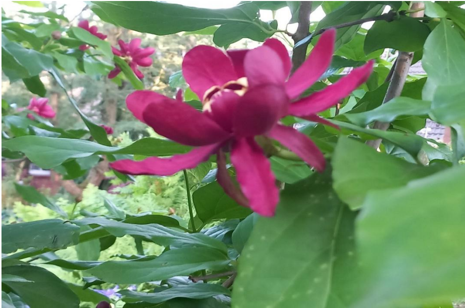
Oben: die Scheinkamelie, Calycanthus „Aphrodite“, blüht bis zum Spätsommer