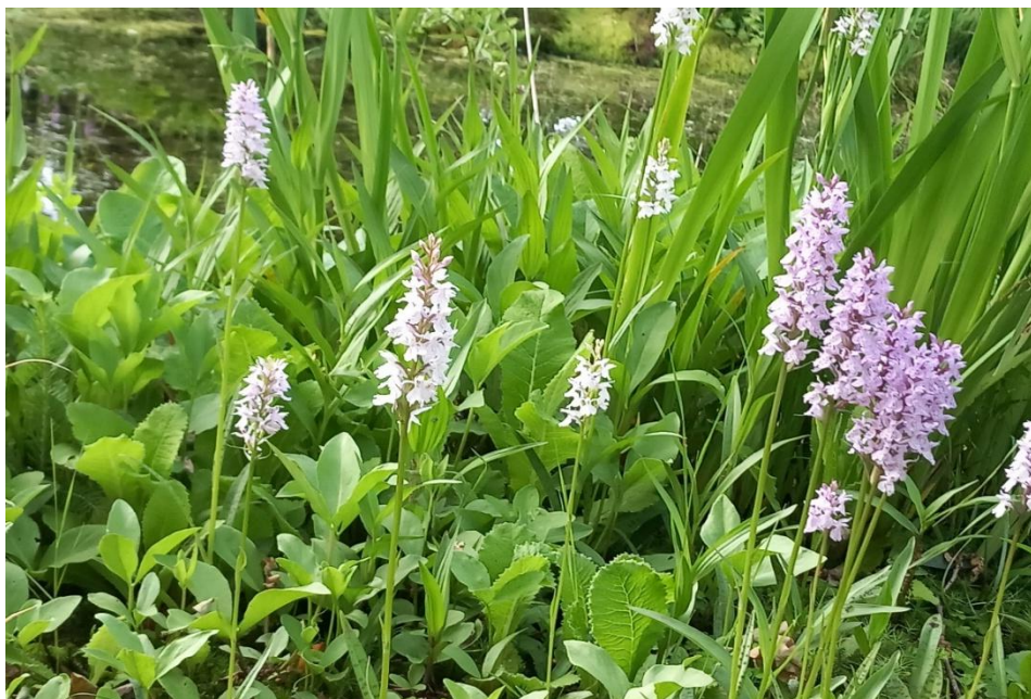
Orchideenblüte am Teich