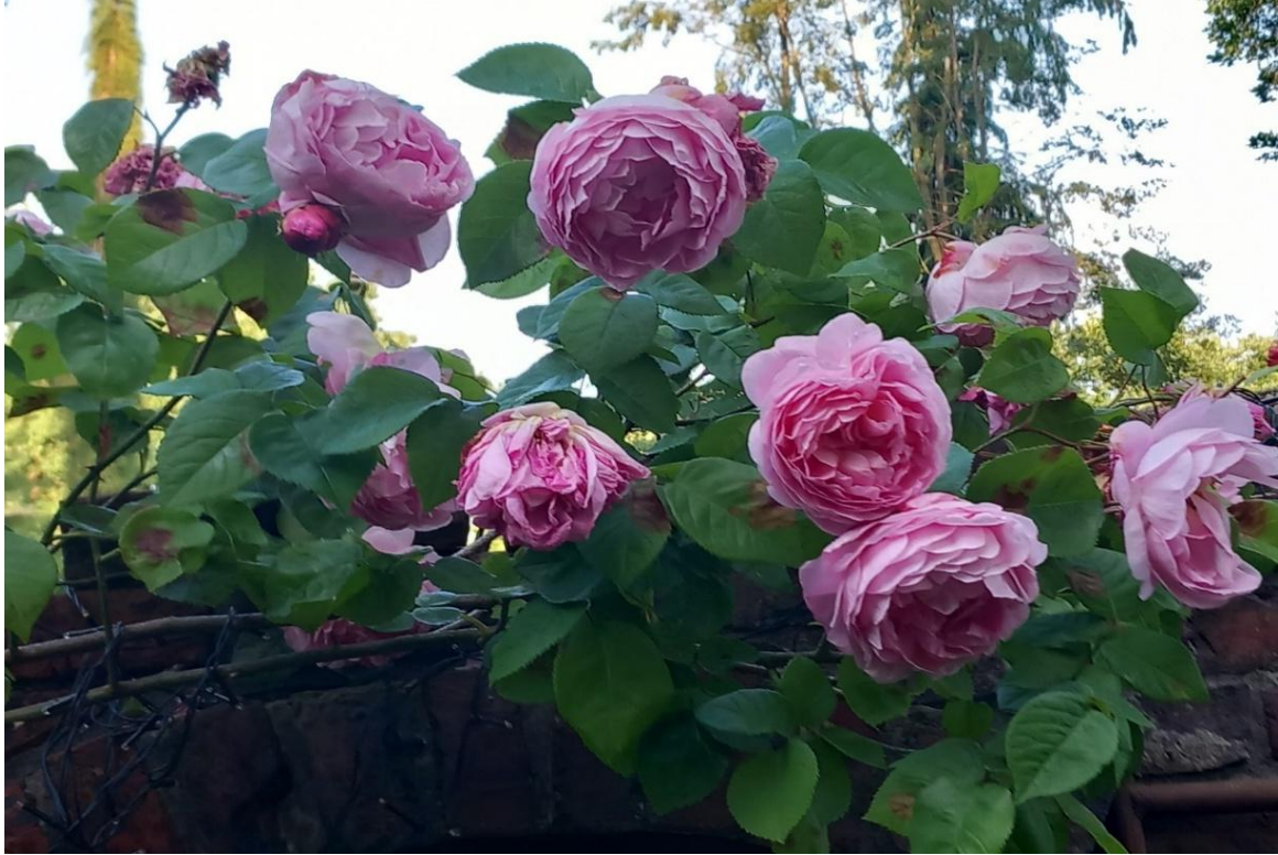
Oben: die Kletterrose „Constance Spry“