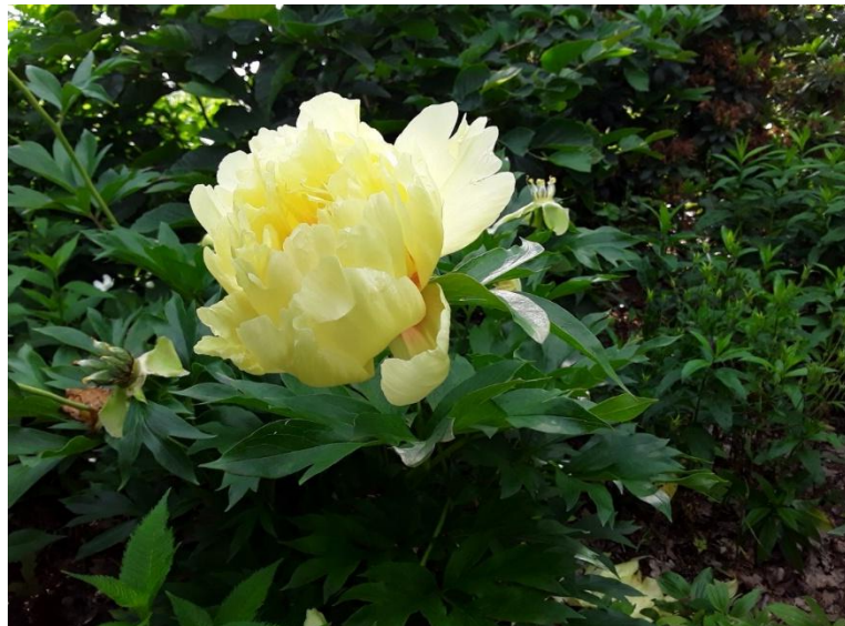
Oben: Paeonia „Bartzella“, eine intersektionelle Hybride, die bis zum Spätsommer nachblüht, hat leuchtend gelbe Blüten mit rötlicher Mitte